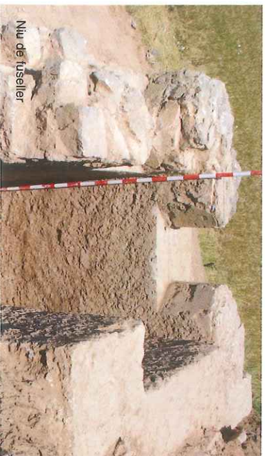
Niu de fuseller

En el entorno próximo a Vallbona de les Monges, se construyó un tramo de la línea defensiva L-2. Su construcción, efectuada en verano de 1938, la llevaron a cabo prisioneros del Batallón disciplinario de Vallbona, mayoritariamente militares del ejército franquista de origen gallego que estaban recluidos en el monasterio de esta localidad, bajo la dirección de las unidades de zapadores y de obras del ejército del Ebro. La tipología de las construcciones era diversa: trincheras, nidos de fusileros, trincheras cubiertas, nidos de ametralladoras y observatorios, que finalmente no se utilizaron porque el 15 de enero de 1939 el nudo de comunicaciones de Tarrega fue ocupado por las tropas franquistas, que llegaron a Maldà y Els Omells de na Gaia. El día 17, el valle del Corb había quedado totalmente rodeado y sus defensas, inoperativas.