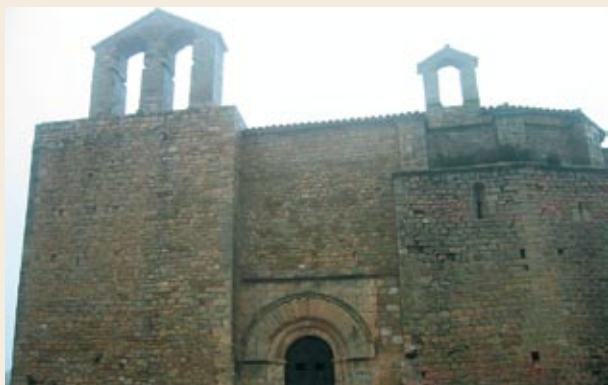
Portalada de l'església de Sant Jaume de Montagut

Esplanada. Des d'on parteixen diverses pistes, bàsicament destinades a la prevenció d'incendis. Seguim per la nostra, que és molt més ampla i fressada, seguint l'ample lloc carener per un bosc esclarissat de pinedes.