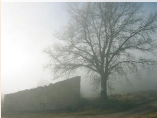
Cases Noves de Formigosa