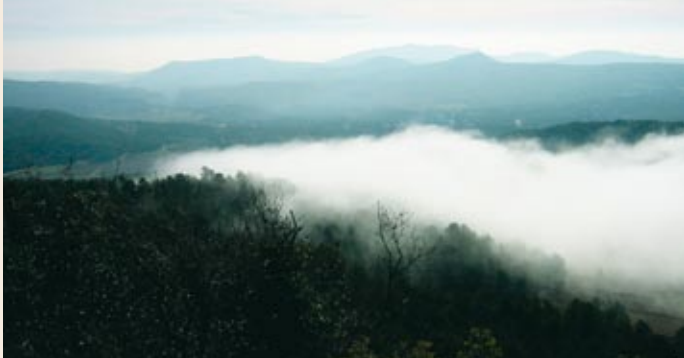
Cim del puig Formigosa

tot i ser un pèl més elevat que el seu veí, Montagut (964 m), no gaudeix ni de bon tros de les perspectives que es poden albirar des d'aquest altre punt.