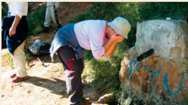
Font del Jovany

Coll del Pinar de la Costa (900 m). Un centenar de metres abans hem deixat, a l'esquerra, un camí de desemboscar poc fressat. Al mig de la collada trobem un encreuament de camins; escollirem el de l'esquerra, que, en direcció nord, co-