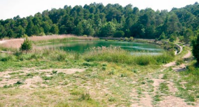
Estany de Formigosa